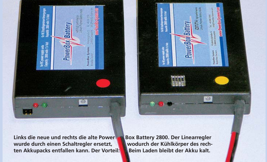
Links die neue und rechts die alte PowerBox Battery 2800. Der Linearregler wurde durch einen Schaltregler ersetzt, den Akkupacks entfallen kann. Der Vorteil: Beim Laden bleibt der Akku kalt.

Nach dem Motto »Das Bessere ist des Guten Feind« hat PowerBox Systems ( www.powerbox-systems.com ) seine Empfängerakkus überarbeitet und noch mehr Sicherheit ins Gehäuse gepackt. Es gibt viele Gründe, diese intelligenten Hightech-Akkus als Bordstromversorgung in wertvollen Flugmodellen einzusetzen.