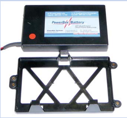
Sichere Befestigung: Der aus Delrin gespritzte Batteriehalter hält den Akku sicher fest – und das selbst bei über 30g Belastung!

nen LiPo-Station werden sämtliche eingebauten Sicherheitsvorkehrungen umgangen!